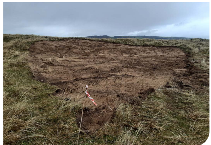
Ar ôl crafu'r tywod