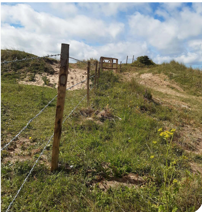
Ffensys atal da byw

Mae Twyni Byw wedi gosod ychydig dros 4 cilometr o ffensys castanwydd i atal da byw, a oedd yn cynnwys adnewyddu hen ffensys, gosod corlannau trin da byw a chodi ffens newydd i ddod â 12 hectar o arwynebedd yn ôl yn addas i'w bori. Gosodwyd gatiu mochyn i hwyluso mynediad i'r cyhoedd.