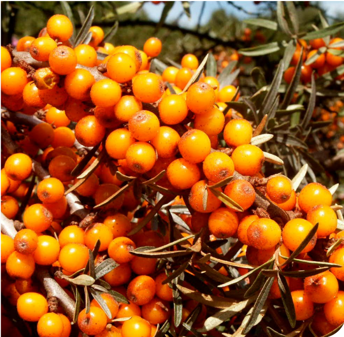
Rhafnwydden y môr

Yn y gorffennol, roedd rhywogaethau estron cadarn, fel rhafnwydden y môr, yn cael eu plannu'n gyffredin ar dwyni Cymru i sefydlogi'r tywod ond ers hynny maent wedi dod yn oresgynnol, gan gymryd drosodd ardaloedd mawr. Er ei fod yn frodorol ar arfordir dwyreiniol Lloegr, nid yw rhafnwydden y môr yn frodorol yng Nghymru ac mae'n tyfu'n ddryslwyni pigog anhreiddiadwy, gan fygwth llesiant y twyni. Mae'n mygu planhigion sy'n tyfu'n isel, yn rhwymo'r tywod ac yn gosod nitrogen yn y pridd gan ddinistrio glaswelltir y twyni sy'n llawn blodau.