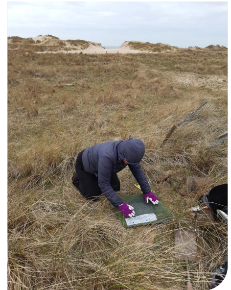
Monitro casglwyr glaw tywod