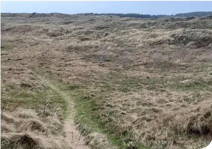
Llac twyni wedi gordyfu: cyn y gwaith crafu

Mae rhai o'r crafiadau hyn hefyd yn gweithredu fel pyllau sy'n darparu dŵr i dda byw trwy gydol y flwyddyn.