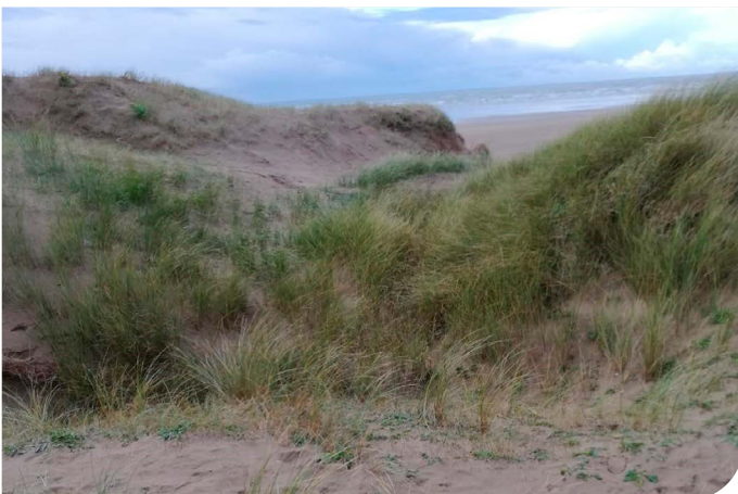
Cyn clirio'r rhicyn

Mae'r prosiect wedi cloddio tri rhicyn mewn ardaloedd a oedd eisoes yn rhannol agored oherwydd y gwynt a cherddwyr.