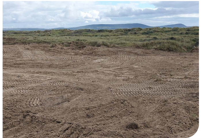
Yr ardal ar ôl y gwaith clirio a chrafu