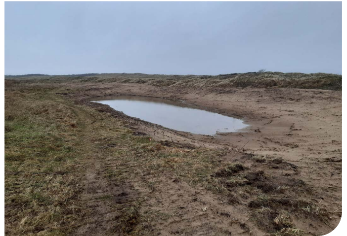
Y llac twyni ar ôl y gwaith crafu