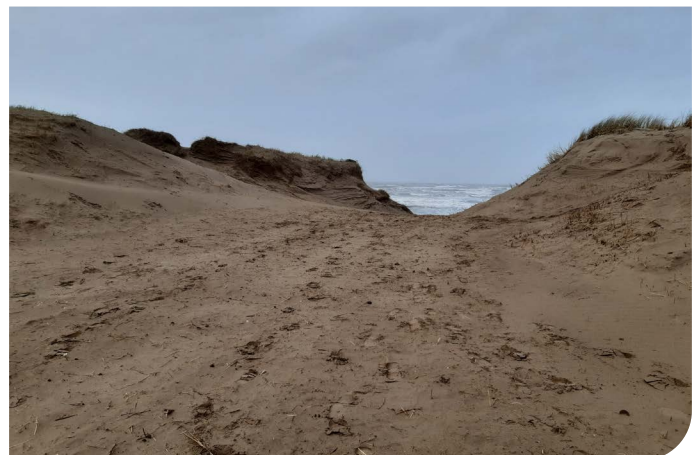
Ar ôl clirio'r rhicyn