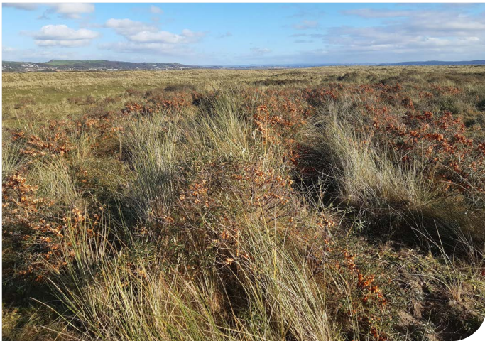
Rhafnwydden y môr: cyn y gwaith clirio a chrafu