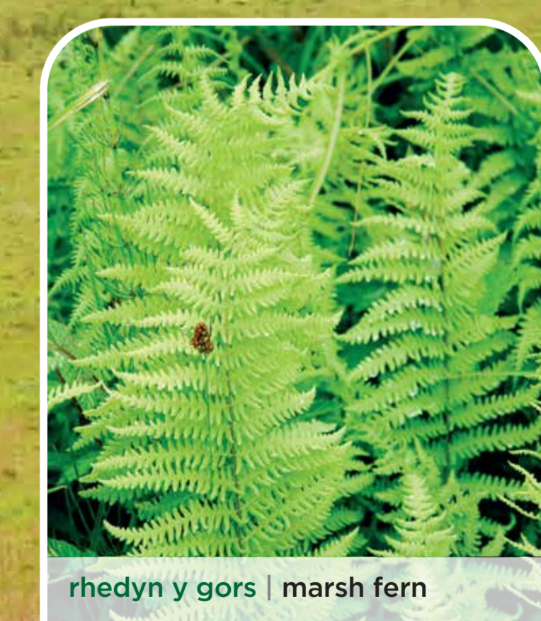
rhedyn y gors | marsh fern