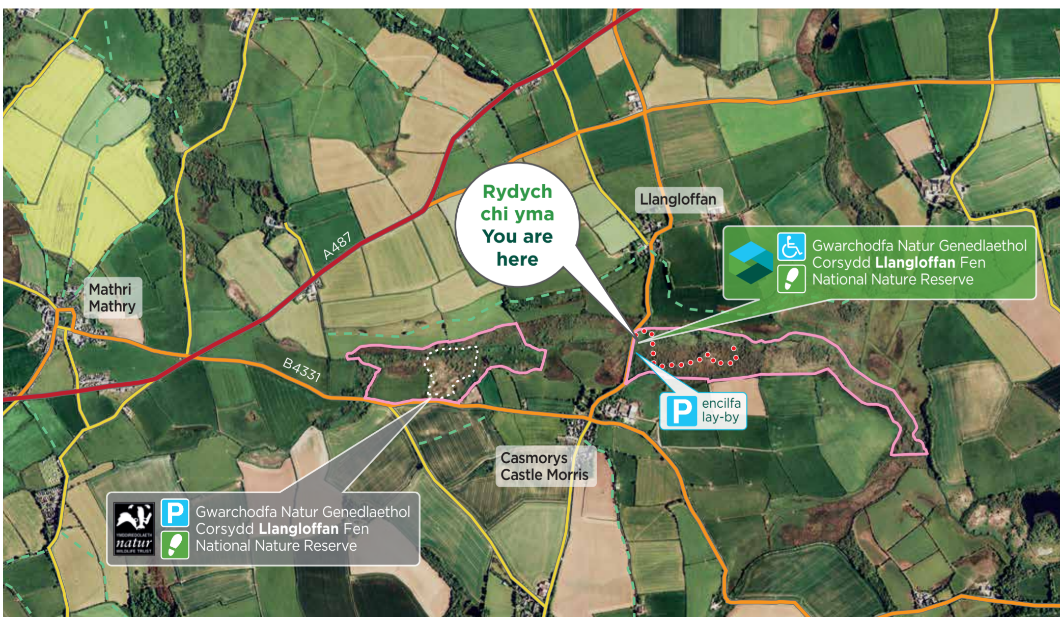
© Airbus Defence & Space a Getmapping. Atgynhyrwydd drwy ganiatâd Llywodraeth Cymru (Taliadau Gwledig Cymru) - Mawrth 2019

Corsydd Llangloffan National Nature Reserve has two parts. The western part is managed by the Wildlife Trust of South and West Wales, whilst we look after the eastern part.