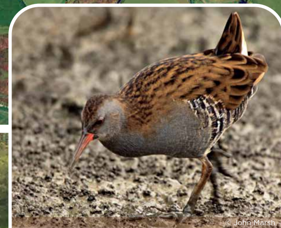
regeu ddŵr | water rail

Highlights: Discover the reserve's fen, swamp and wet woodland on our fully accessible boardwalk.