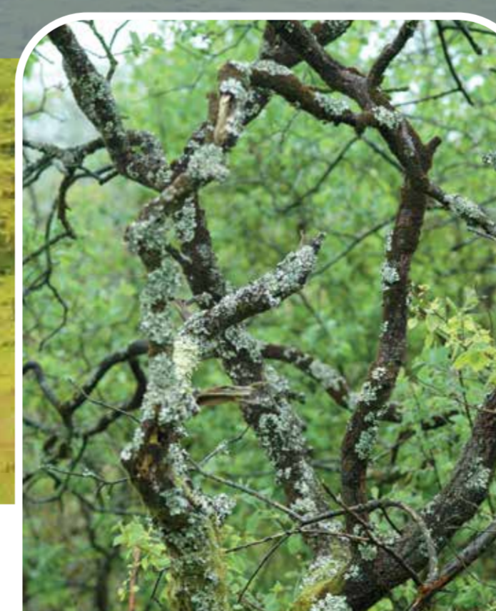
cennau | lichens

Because of the rich pickings offered here, birds of prey are attracted frequently, including buzzards, kestrels, sparrowhawks and barn owls.