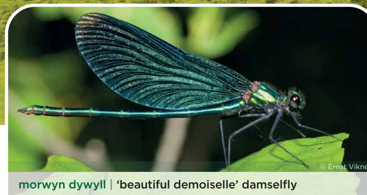
morwyn dywyll | 'beautiful demoiselle' damselfly

Oherwydd bod digon o ddewis yma, daw adar ysglyfaethus draw'n rheolaidd, gan gynnwys bwncathod, cudyllod coch, gweilch glas a thylluanod gwynion.