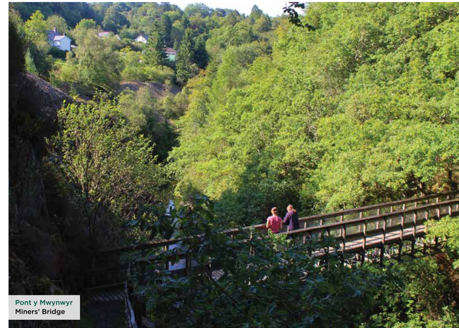
Pont y Mwynwyr Miners' Bridge