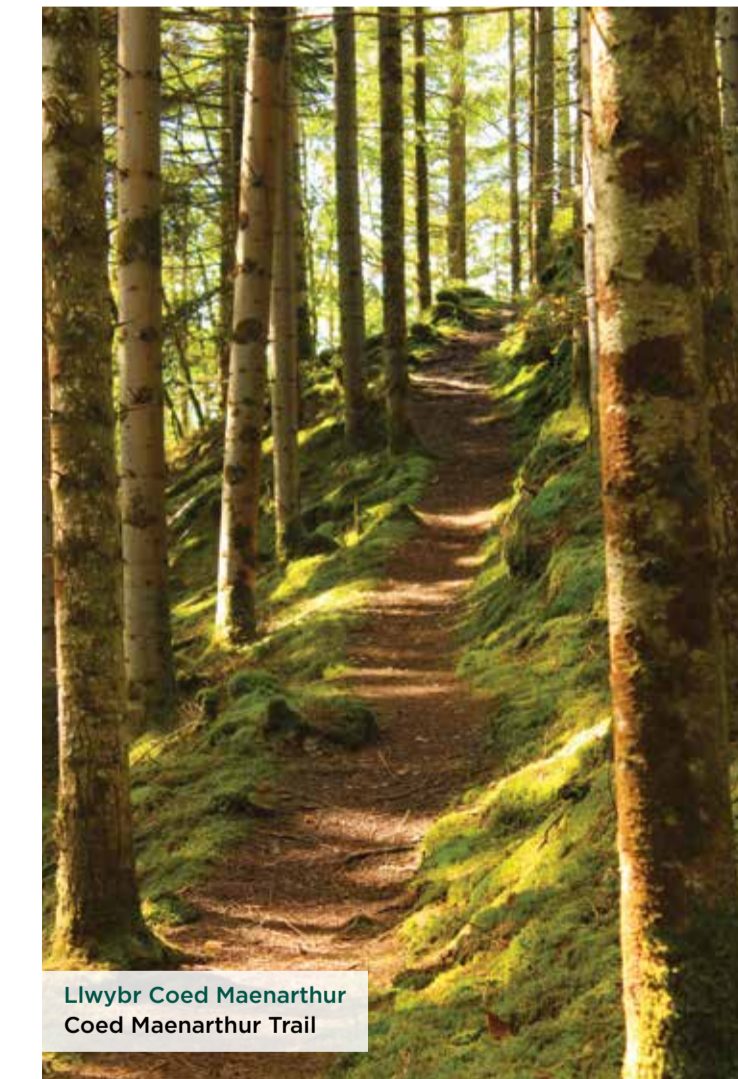
Llwybr Coed Maenarthur Coed Maenarthur Trail