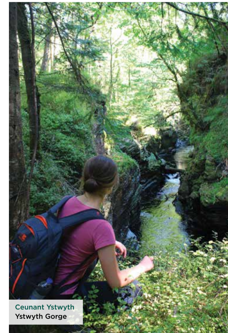
Ceunant Ystwyth Ystwyth Gorge