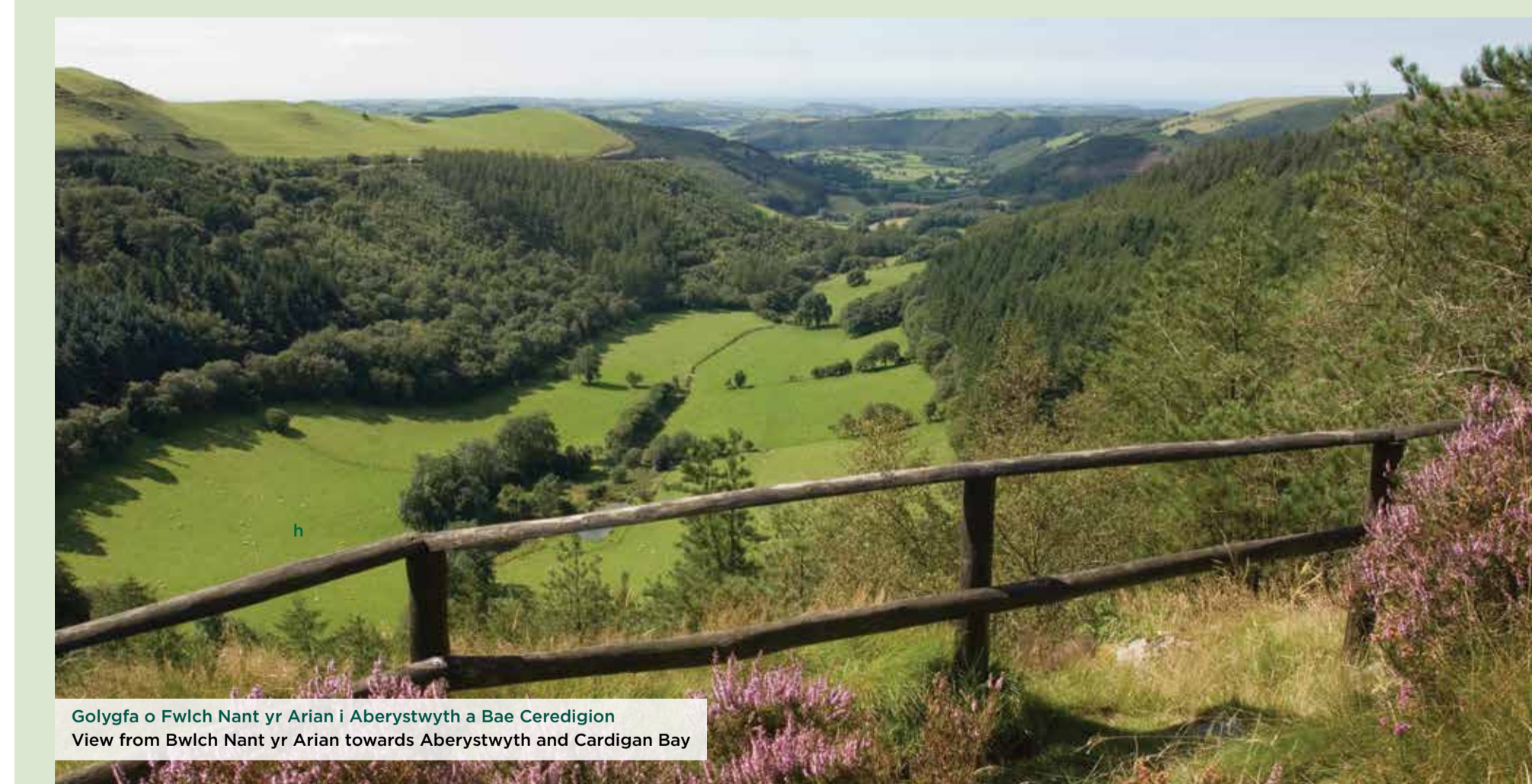
Golygfa o Fwlch Nant yr Arian i Aberystwyth a Bae Ceredigion View from Bwlch Nant yr Arian towards Aberystwyth and Cardigan Bay

What can you do from here? Why not try our waymarked trail to experience some of this woodland's best features?