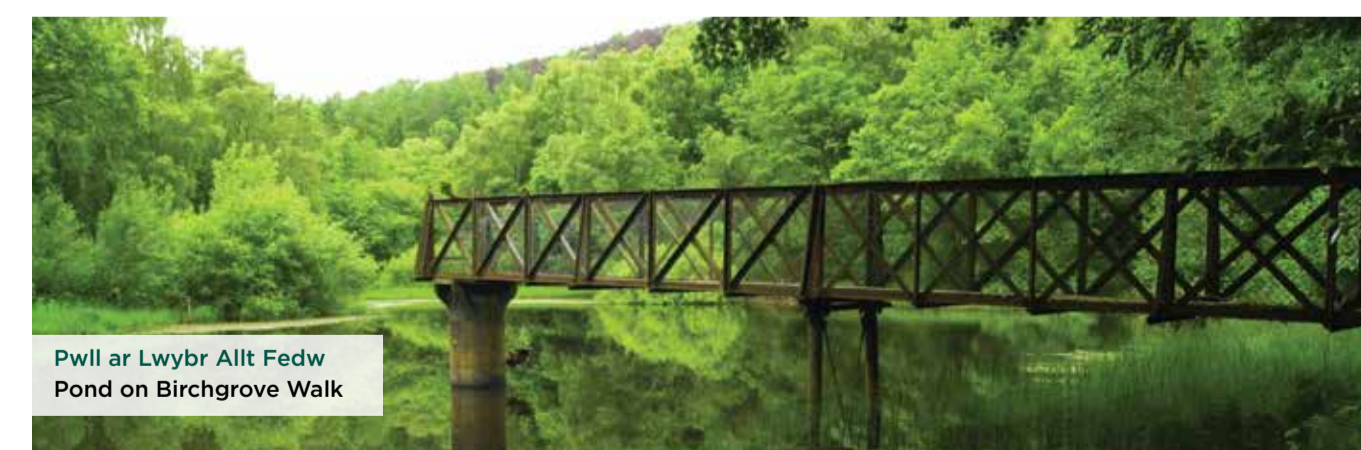
Pwll ar Llwybr Allt Fedw Pond on Birchgrove Walk

Atgynhychir y map hwn o ddeunydd yr Arolwg Ordnans gyda chaniatâd Arolwg Ordnans ar ran Rheolwr Llyfrfa Ei Mawrhydi. © Hawlfraint y Goron a hawliau cronfa ddata 2018 Arolwg Ordnans 100019741. This map is based upon Ordnance Survey material with the permission of Ordnance Survey on behalf of the controller of Her Majesty's Stationery Office © Crown copyright and database rights 2018 Ordnance Survey 100019741.