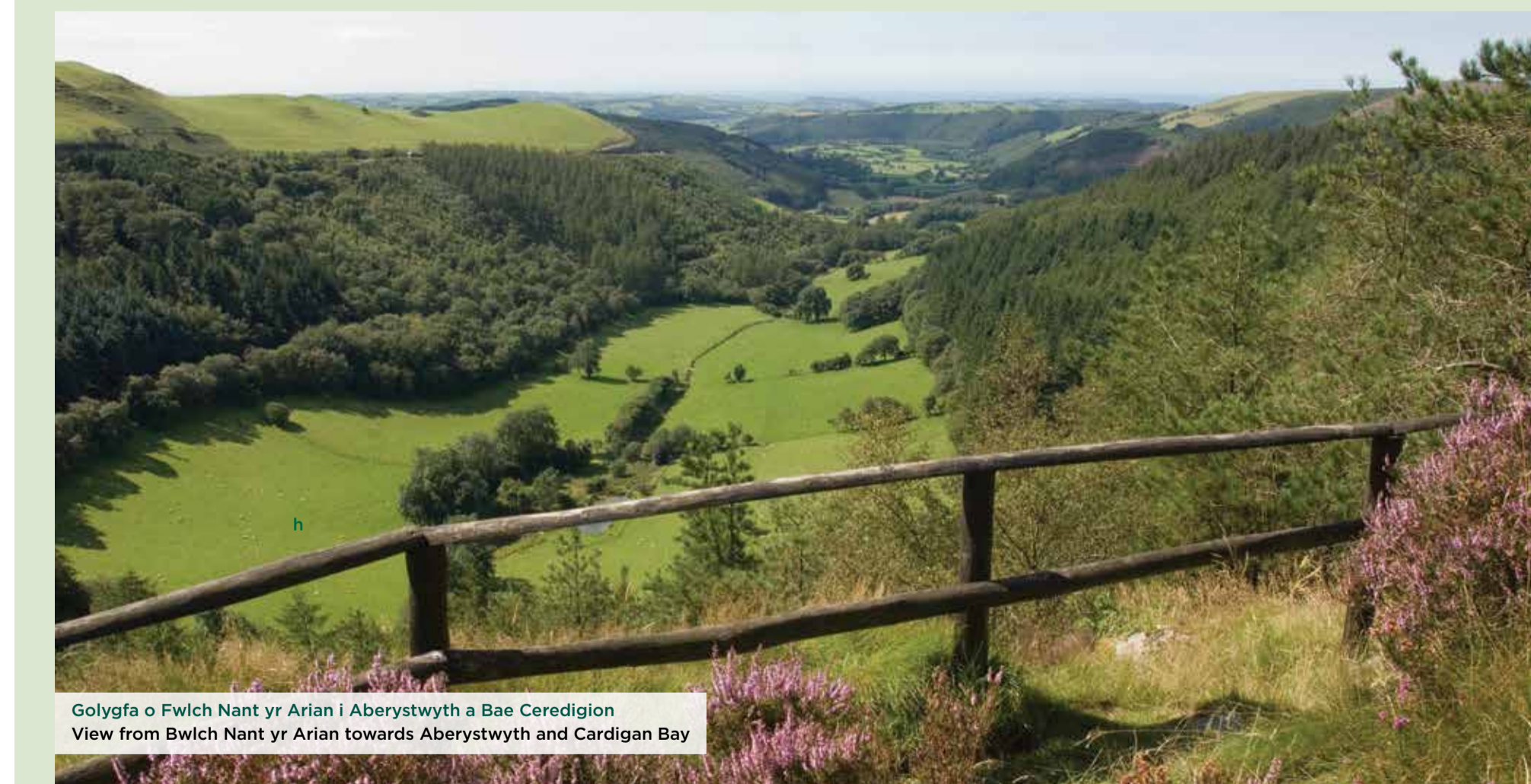
Golygfa o Fwlch Nant yr Arian i Aberystwyth a Bae Ceredigion View from Bwlch Nant yr Arian towards Aberystwyth and Cardigan Bay

Natural Resources Wales is proud to look after some real gems in this scenically dramatic yet tranquil part of Wales.