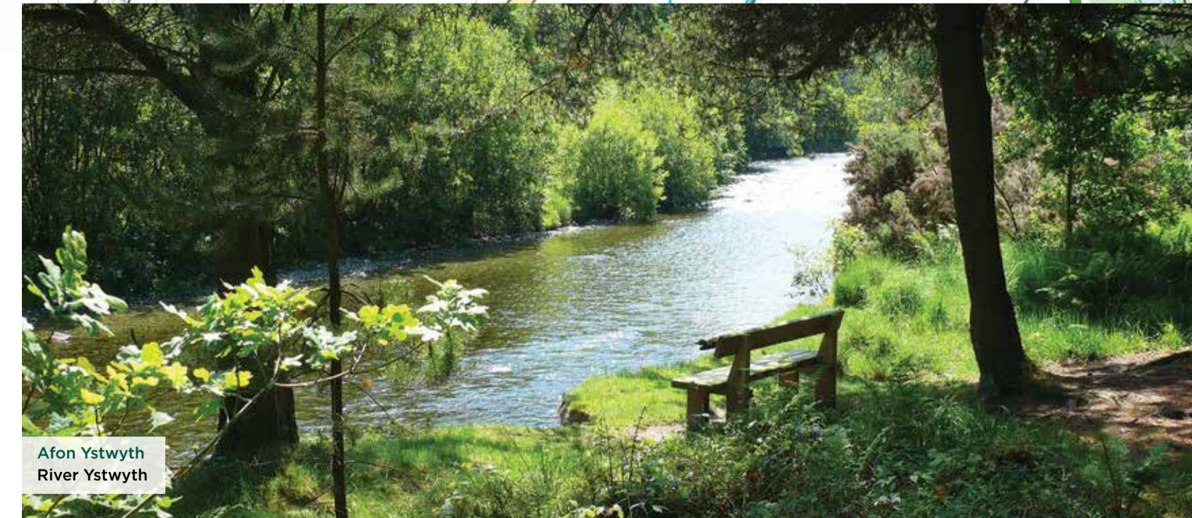
Afon Ystwyth River Ystwyth