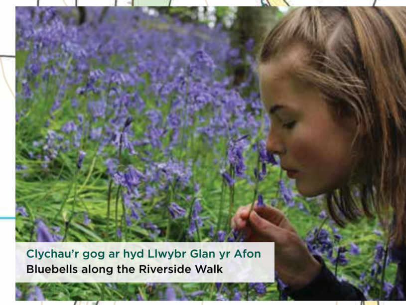
Clychau'r gog ar hyd Llwybr Glan yr Afon Bluebells along the Riverside Walk

Atgynhychir y map hwn o ddeunydd yr Arolwg Ordnans gyda chaniatâd Arolwg Ordnans ar ran Rheolwr Llyfrfa Ei Mawrhydi. © Hawlfraint y Goron a hawliau cronfa ddata 2018 Arolwg Ordnans 100019741. This map is based upon Ordnance Survey material with the permission of Ordnance Survey on behalf of the controller of Her Majesty's Stationery Office © Crown copyright and database rights 2018 Ordnance Survey 100019741.