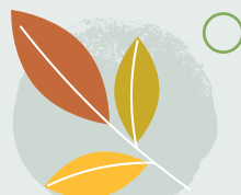
14. Dysgu am natur