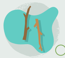
13. Rasio brigau