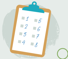
5. Helfa drysor dymhorol