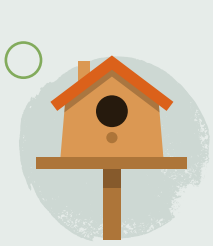
6. Gwneud cartref i fywyd gwylt