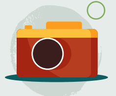
12. Tynnu llwyth o luniau