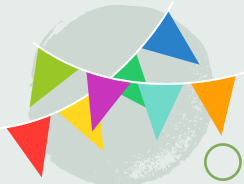
15. Rhoi cynnig ar fabolgampau yn y Goedwig