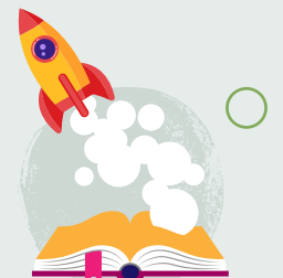
20. Dychmygu'ch hun yn eich hoff lyfr

Bydd pob newid a wnewch yn helpu ni i'ch helpu chi.