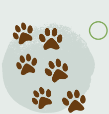
7. Chwilio am lwybrau anifeiliaid