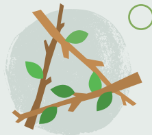
4. Creu celf yn y goedwig