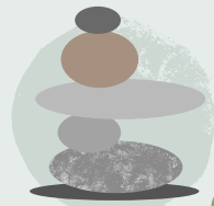
3. Adeiladu tŵr cerrig