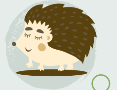
2. Chwilio am fywyd gwylt