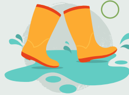
18. Sblasio mewn pyllau yn eich esgidiau glaw