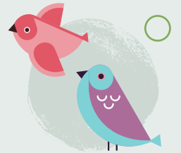
11. Gwyllo adar