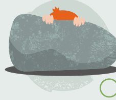
19. Chwarae cuddio