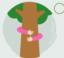
9. Cwtsio coeden