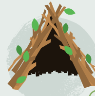
10. Adeiladu cuddfan