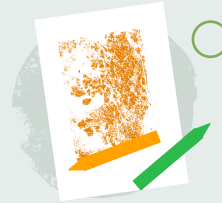
1. Rhoi cynnig ar rwbio rhisgl