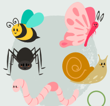
17. Chwilio am fwystfilod bach