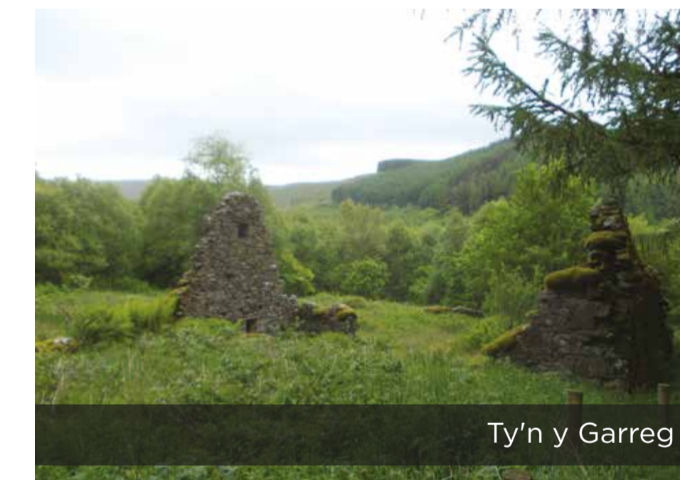
Ty'n y Garreg