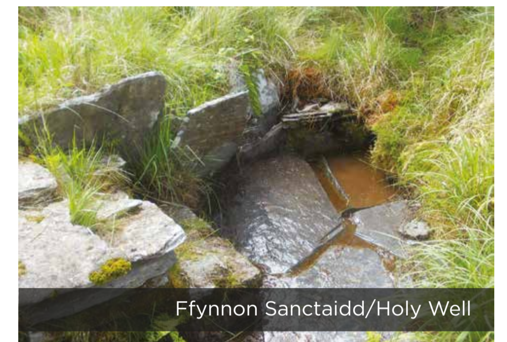
Ffynnon Sanctaidd/Holy Well