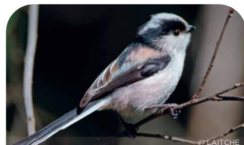
titw cynffon-hir long tailed tit

HIGHLIGHTS: This waymarked circular walk starts from the car park and goes to a viewpoint over the Cleddau Estuary with a bench. Along the way, there is an informal picnic area with wooden benches carved from tree trunks.