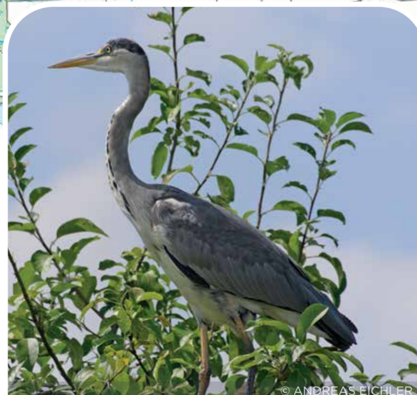
crêyr glas heron