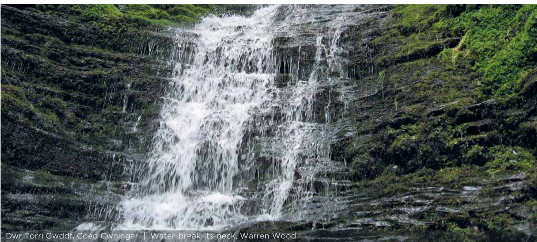
Dŵr Torri Gwddf, Coed Cwningar | Water-break-its-neck, Warren Wood