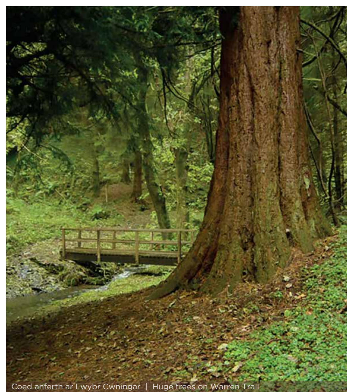
Coed anferth ar Lwybr Cwningar | Huge trees on Warren Trail