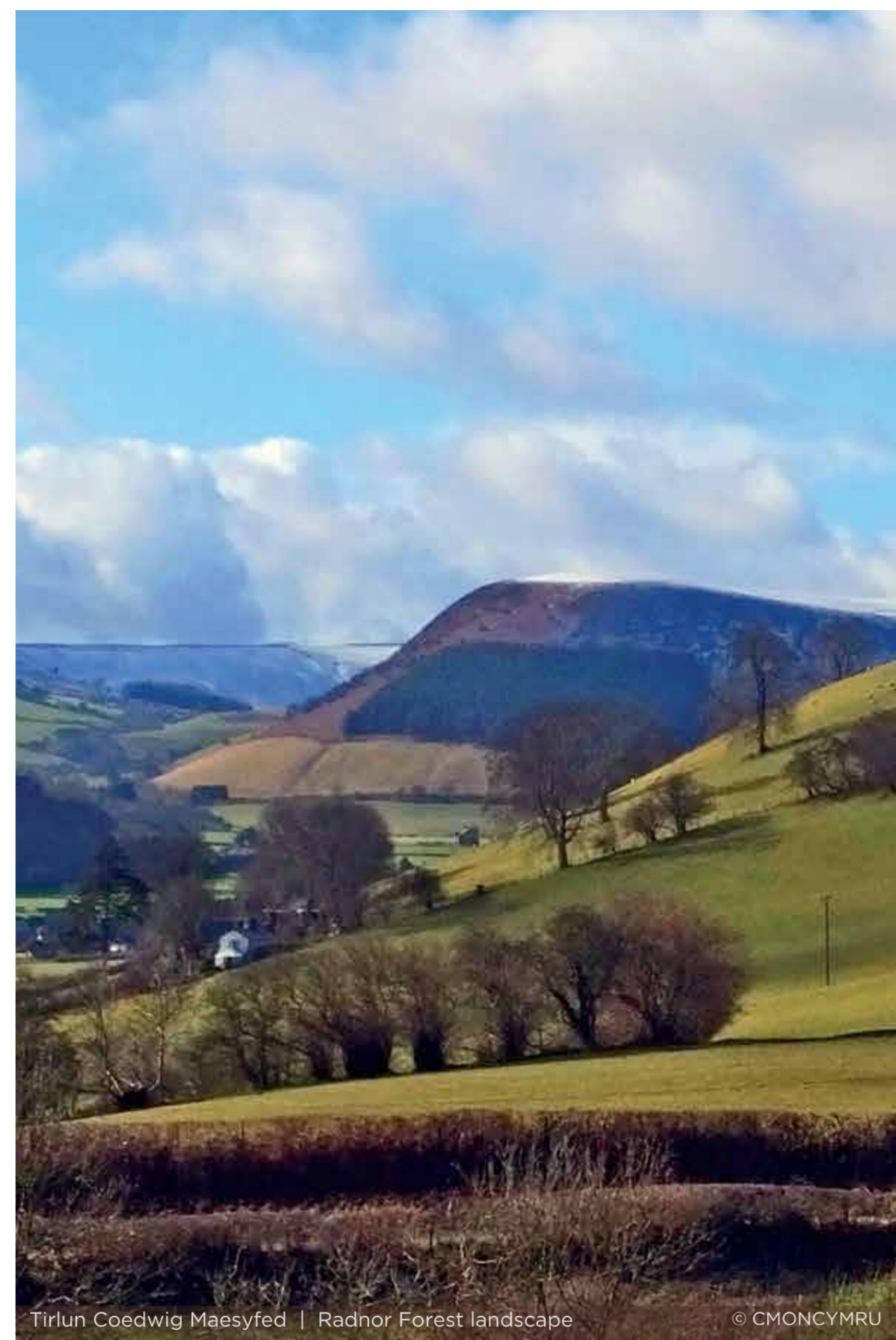
Tirlun Coedwig Maesyfed | Radnor Forest landscape

Open areas within the forest offer stunning views of Cadair Idris and Snowdonia to the north-west, the Long Mynd to the north-east, across to the Malvern Hills to the east and the Brecon Beacons to the south. It has been said that if you travel due east from the highest point of the forest, Black Mixen Hill, the next highest point you come to is the Russian Urals!