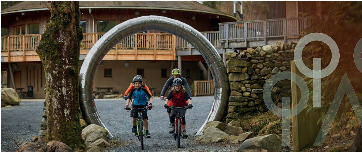
Am ragor o wybodaeth darllenwch ein Cynllun Corfforaethol llawn www.cyfoethnaturiol.cymru

Bydd hyn yn sicrhau ein bod yn uchelgeisiol ac yn drylwyr wrth fonitro'r amgylchedd naturiol yng Nghymru a'r manteision y mae'n eu darparu, a'n perfformiad ein hunain a sut yr ydym yn cyfrannu at lesiant yng Nghymru ar hyn o bryd ac ar gyfer cenedlaethau'r dyfodol.