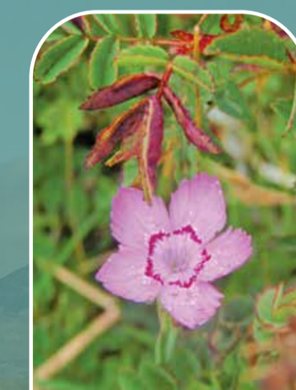
Penigan y forwyn Maiden pink

We have fenced off some parts of the reserve to allow grazing or to protect fragile dune plants.