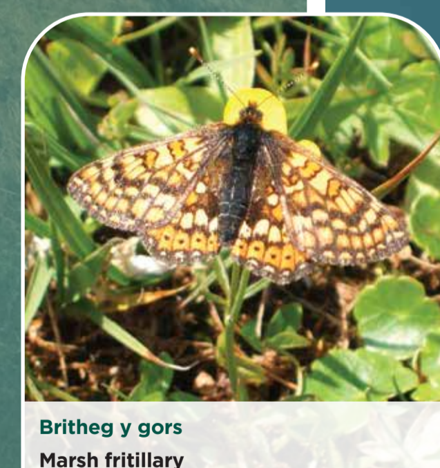
Britheg y gors Marsh fritillary