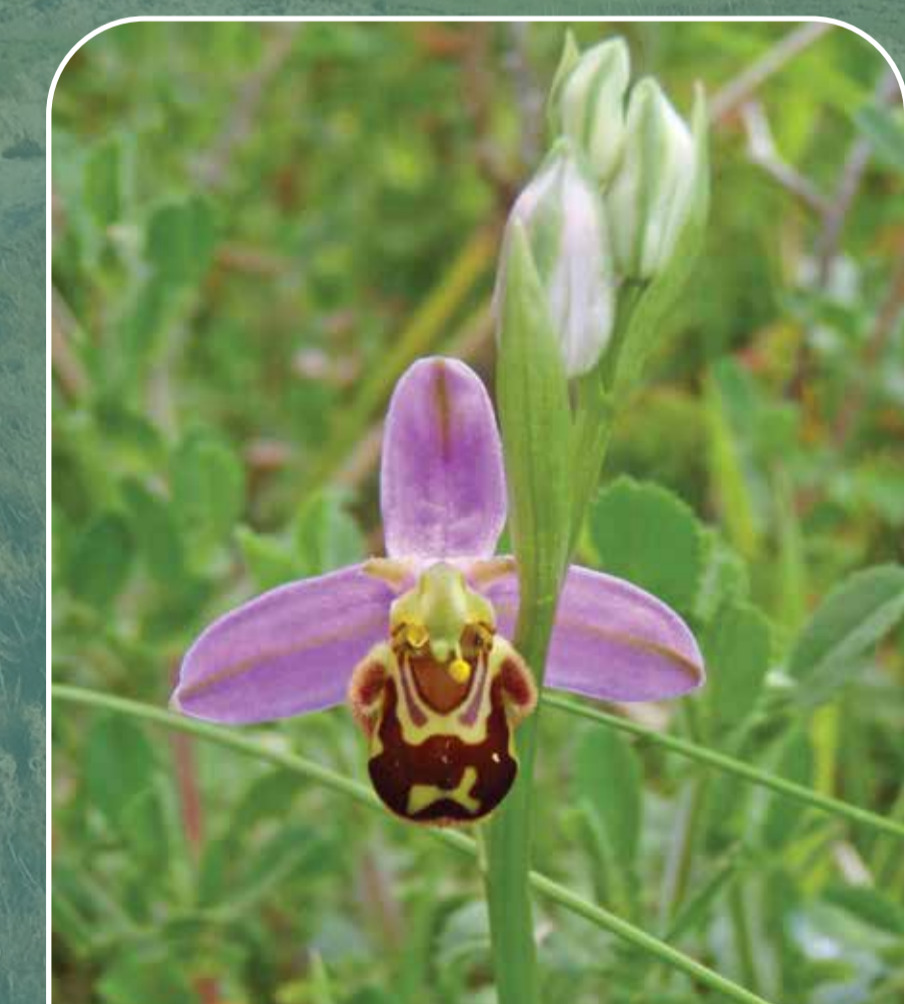
Tegelrian y wenynen - Mae'n dywared y wenynen i'w denu Bee orchid - Mimics a bumblebee to attract them