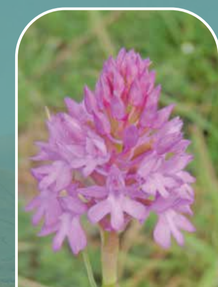
Tegelrian bera Pyramidal orchid