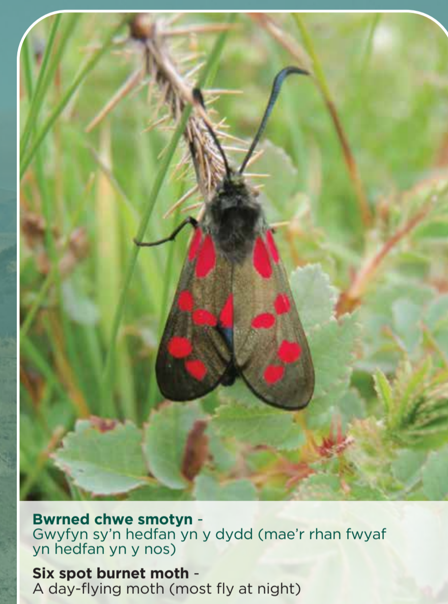
Bwrned chwe smotyn - Gwifryn sy'n hedfan yn y dydd (mae'r rhan fwyaf yn hedfan yn y nos) Six spot burnet moth - A day-flying moth (most fly at night)