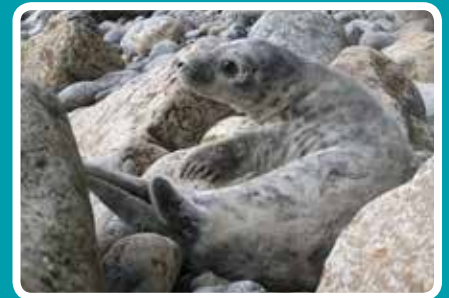
DOSBARTH IV (16-20 DIWRNOD) Siâp fel III ond wedi colli rhywfaint o'r ffwr gwyn (bydd cot oedolyn yn ei le). Wedi neu ar fin cael ei ddiddyfnu.