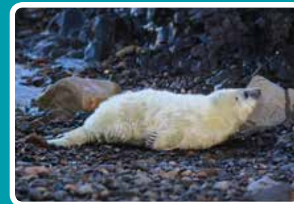
DOSBARTH II (6-10 DIWRNOD) Corff llyfnach. Mae'r gwddf i'w weld o hyd, ond nid oes crychion llac o amgylch y corff. Mae'r got yn wynnach. Swnllyd iawn.