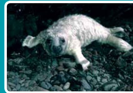
DOSBARTH I (0-5 DIWRNOD) Corff tenau, gwddf amlwg, croen mewn crychion llac o amgylch y corff. Gall y got fod braidd yn felyn. Yn symud yn eithaf lletchwith.