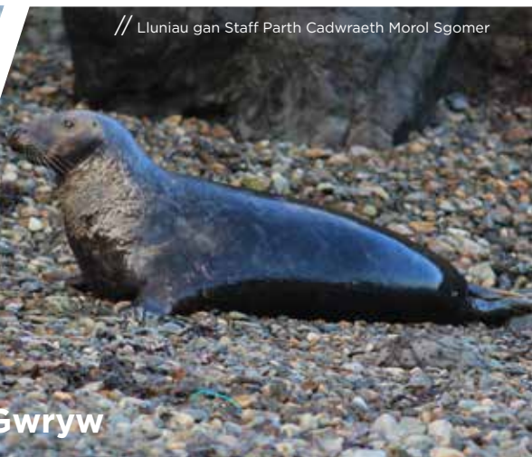
// Lluniau gan Staff Parth Cadwraeth Morol Sgomer