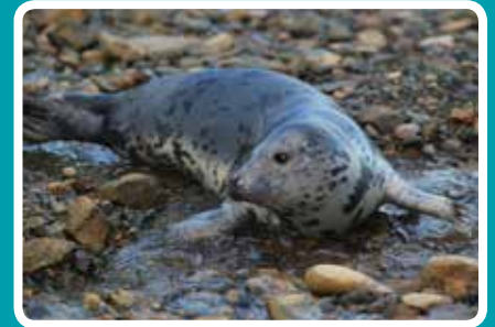
DOSBARTH V (21+ DIWRNOD) Y ffwr gwyn wedi'i ddiosg yn llwyr. Mae'n colli rhywfaint o bwysau ar ôl diddyfnu. Yn aml yn symud i ffwrdd o'r ardal fridio.