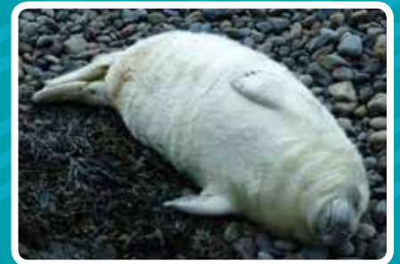
DOSBARTH III (11-15 DIWRNOD) Corff crwn neu siâp casgen. Ni ellir gweld y gwddf. Cot wen.

PERYGL! Cadwch draw o ymyl y clogwyn. Gallai gwynt cryf neu lithriad fod yn angheuol.