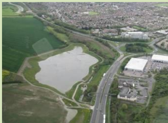
Cynllun amddiffyn rhag llifogydd Horsbere Brook, Caerloyw

Mae Caerloyw a phentrefi ar hyd Afon Hafren o Haw Bridge i Minsterworth mewn perygl o lifogydd afonol yn ogystal â llifol, gyda llifogydd llifol yn ennill lle blaenllaw i lawr yr afon o Minsterworth.