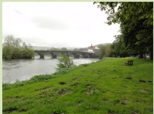
Y Clas ar Wy, Afon Gwy

Mae'r afonydd yn draenio i mewn i Aber Hafren, ac mae nifer o brif drefi a dinasoedd mewn perygl o lifogydd llanwol.