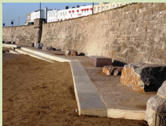
Morglawdd yn Weston-super-Mare

Mae tir gwastad wrth ymyl Aber Hafren mewn perygl o lifogydd llanwol. Morgloddiau sy'n gwarchod Weston-super-Mare a Clevedon rhag llifogydd.