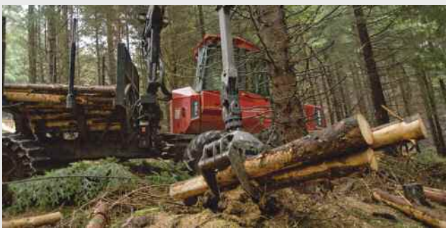
Nhabl 1: Lefelau Cynllun Marchnata Comisiwn Coedwigaeth Cymru, boncyffion gwerthadwy gan gynnwys prennau caled.

Gan ddibynnu ar alw'r farchnad, gall y swm gwirioneddol a gaiff ei gynaeafu a'i gyflenwi fod yn fwy neu'n llai mewn unrhyw flwyddyn.